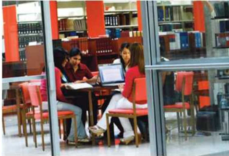
El espacio de las bibliotecas se convierte en punto de encuentro para las investigaciones.